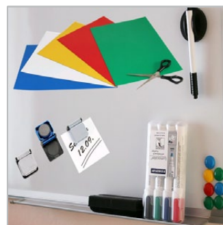
magnesy, paski i taśmy magnetyczne