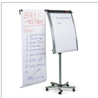
flipcharty i akcesoria