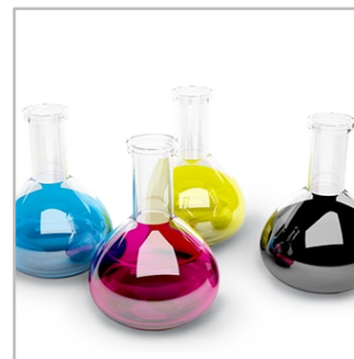
atramenty dedykowane marki OCP