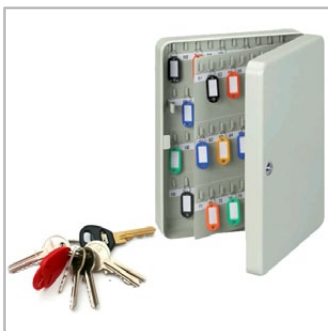
szafki na klucze