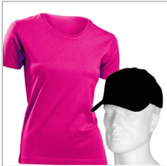
koszulki i inne tekstylia