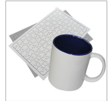
kubki, puzzle, metale i inne materiały