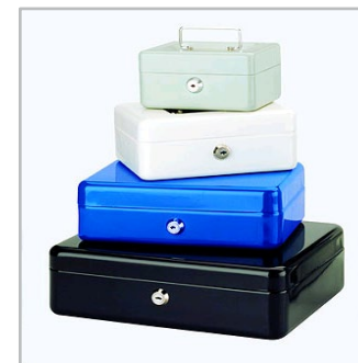
kasetki na pieniądze