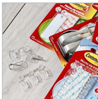
masy mocujące i haczyki