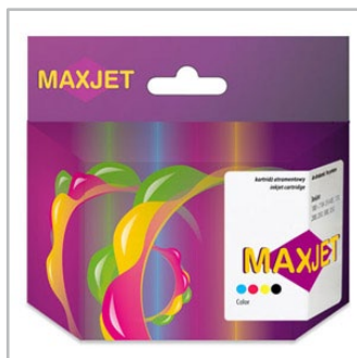
kartridże do drukarek