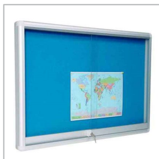
gabloty do prezentacji