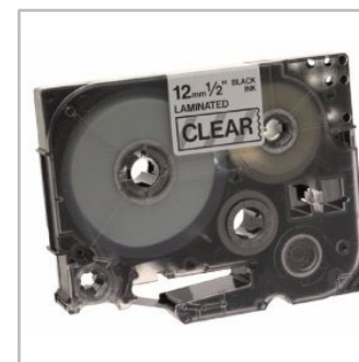
taśmy do drukarek i faksów