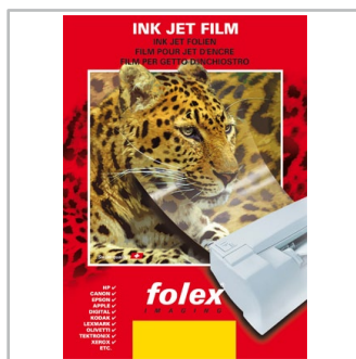
folie do drukarek