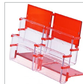
stojaki, potykacze i tabliczki