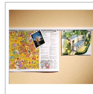
Exporail system prezentacji