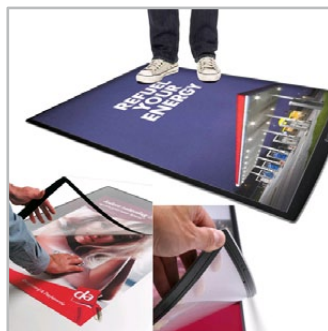
prezenty na podłogę