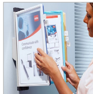
ramki do plakatów