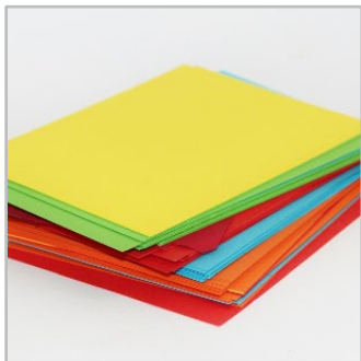
papiery i folie