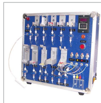
urządzenia do regeneracji