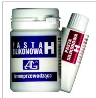
chemia dla elektroniki