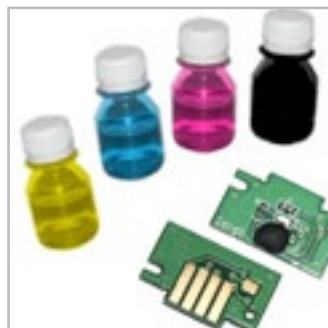
atramenty i chipy do ploterów