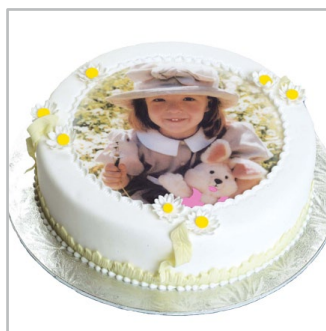
tusze i papiery jadalne