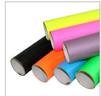
folie flex i flock